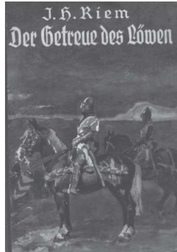
Abb. 4: Der Getreue des Löwen von Ilse Hildegard Riem (1934)

In Ernst-August Roloffs Heinrich der Löwe , 1936 in Braunschweig erschienen, wird hingegen ein traditionell-heimatkundebezogenes Bild des Welfenherzogs mit der Vermittlung der nationalsozialistischen Ideologie im Geschichtsunterricht verquickt. Heinrich wird als mutiger und besonders ritterlicher Gegner der mächtigen Staufer geschildert, der sich immer wieder im Kampf erfolgreich bewähren kann. In Rudolf Stahls geschichtlichem Lebensbild Heinrich der Löwe (1934) kontrastiert der Verfasser die Errungenschaften Heinrichs als ‚Ostkolonisor‘ und Führerfigur ebenfalls mit dem als gescheitert charakterisiertem Programm des staufischen Kaiser-