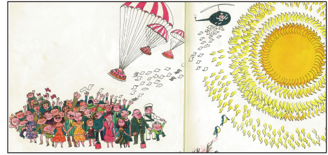
54 Illustratorische Inszenierung in Die Polizeituba